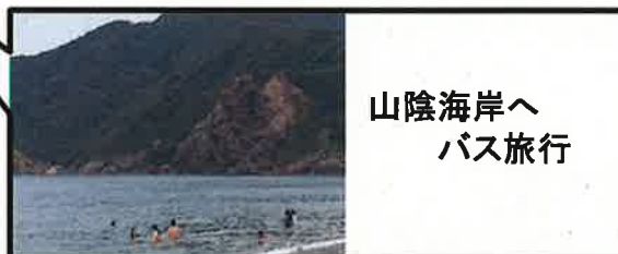
山陰海岸へ バス旅行