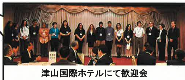
津山国際ホテルにて歓迎会