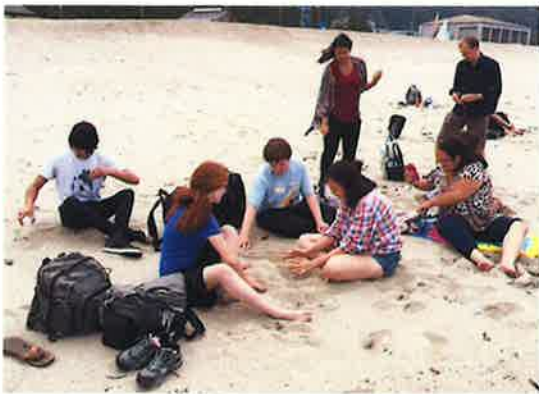
早速、砂浜で遊んでます♪日本海の砂はさらさらで、気持ちいい～。

The 2 nd day, the delegation went to field trip to Sanin seashore. Since Santa Fe is located inside the US, people who live in Santa Fe have few chance to enjoy the ocean. So dose the students and They enjoyed the beach and swimming. Also, the students ride on the sightseeing tour boat and saw seashore and strangely shaped boulders. The boulders eroded by the wave for long time is artistic shape and the students took so many pictures holding their camera.