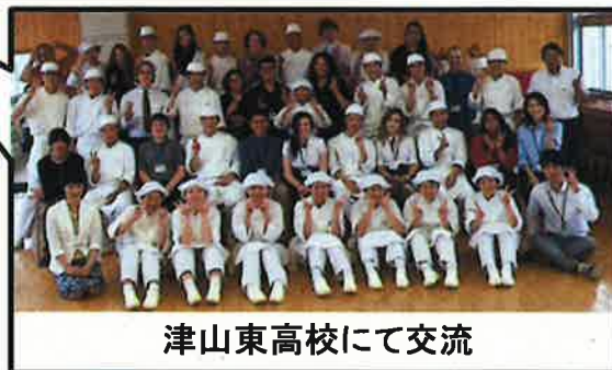
津山東高校にて交流