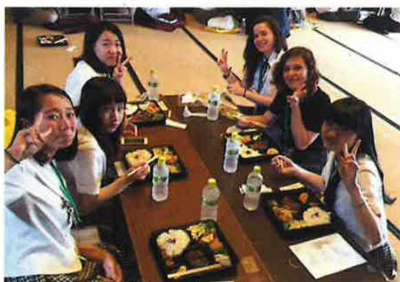
ランチタイム☆みんなでお弁当をいただきました。 Lunch time, the students ate Japanese lunch box.

交流が終わった後のサンタフェ高校生と津山商業高校生徒との別れは名残惜しそうでした。午後、ホストファミリーと津山サンタフェ友好協会の会員でバスに乗って出発するサンタフェ高校生を見送りました。サンタフェ高校生にとって忘れえない思い出になったと思います。一行は6月15日の朝、東京から帰路へ着き、6月16日に無事サンタフェ市に帰りました。