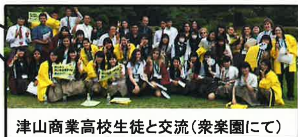
津山商業高校生徒と交流(衆楽園にて)