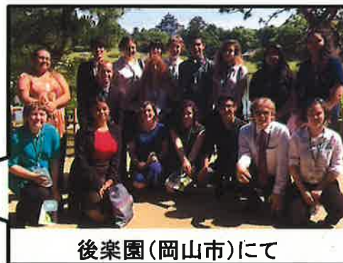
後楽園(岡山市)にて