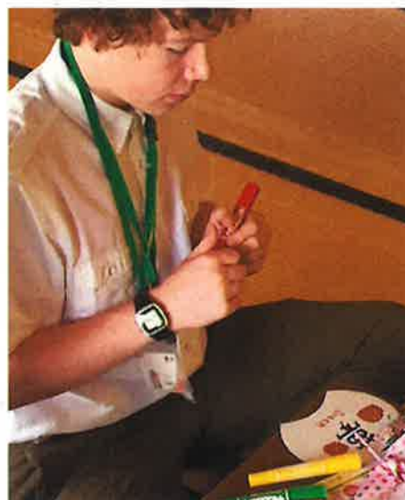
うちわに自分の願いを描いています。 どんな夢なのかな？ Drawing a wish on the paper fun. What kind of dream you wish?