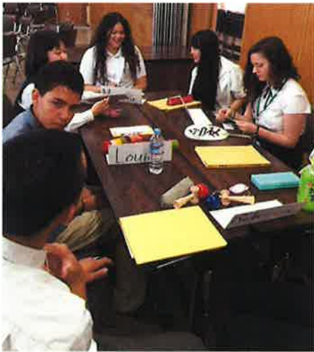
初めまして。お互いに英語で自己紹介です。 Nice to meet you! Self introduction using English

The 5 th day, the last day of Tsuyama-stay. It was so fast for both of the students and host family. Today, the students visited Tsuyama commercial high school. They joined some cultural and communication classes. After they played some game and joined English communication activity with Tsuyama commercial high school students, They visited Shuraku-en garden and Tsuyama commercial high school students guided them using English. At the guest house of Shuraku-en garden, They enjoyed making a flat paper fan and origami(the are of holding paper ). It was great moment with full of smile and laughing .