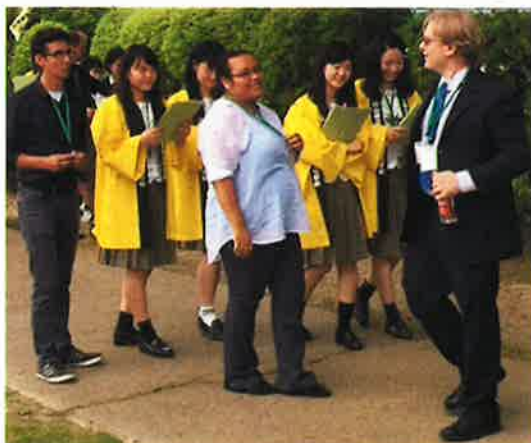
津山商業高校生徒による衆楽園ツアーガイド中 (頑張って英語で説明しています) Guide tour by Tsuyama commercial high school students.(the students tried to communicate with each other using English somehow.)