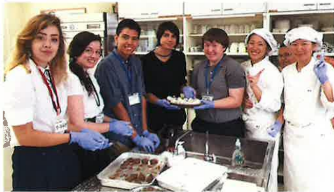
団子、完成しました～！！