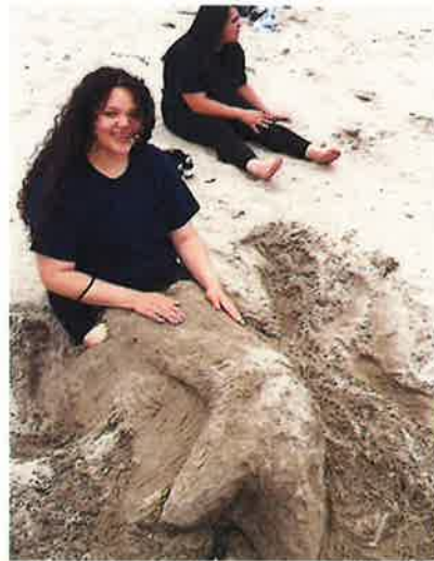
人魚姫になりました～☆

Enjoyed the beach! Japan sea sand is so smooth and dry feel nice to touch.