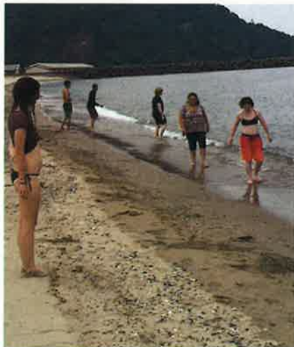
ビーチで楽しむサンタフェ高校生 How was the beach? Seemed they enjoying