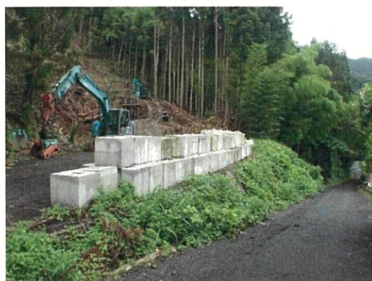
【コンクリートブロックや大型土のうによる堰堤】