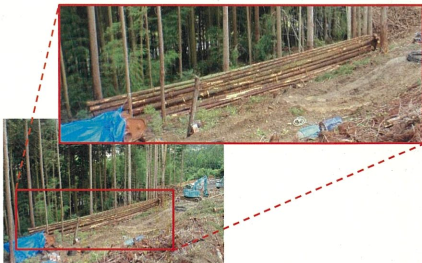
【現地木を活用した流出防止柵の設置】