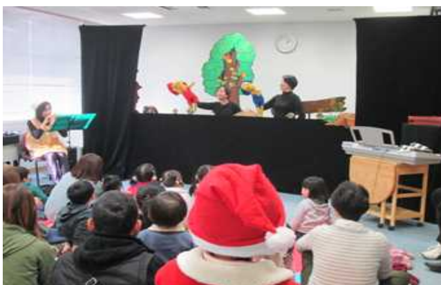
読み聞かせボランティア「たんぼぼの家」の皆さんによる人形劇「ぐりとぐら」 子どもたちの目は釘づけ・・・