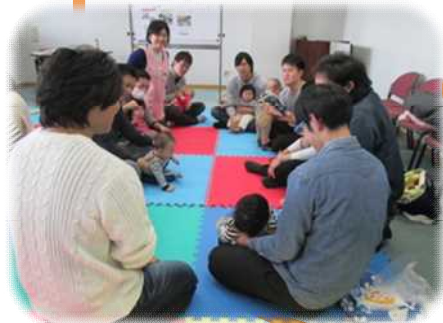
お父さん同士の話ができて良かったです。