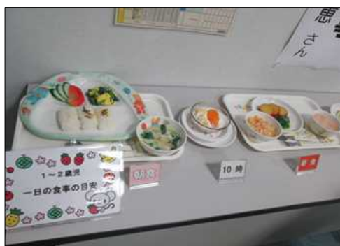
1～2歳児 1日の食事の目安