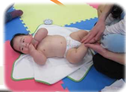
子どもと触れ合う時間が持てて良かった。