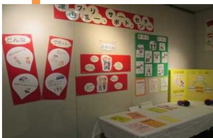
「さん・さん祭り」の展示会場でファミ・サポの活動を紹介

約100人の参加者が人形劇、紙芝居、トーンチャイムの演奏を楽しみました。サンタさんから全員にプレゼントがもらえうれしかったね。