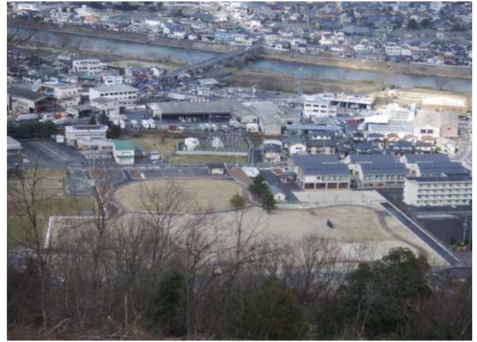
【整備中】 井口公園 【撮影】平成27年2月