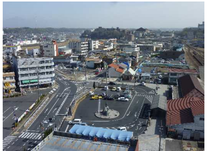
【整備中】 津山駅北口広場 【撮影】平成27年2月