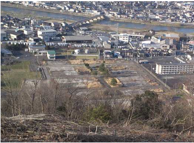
【整備前】 井口公園 【撮影】平成23年8月