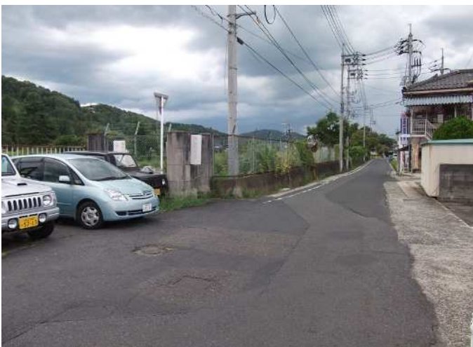
【整備前】 市道G023号線 【撮影】平成24年4月