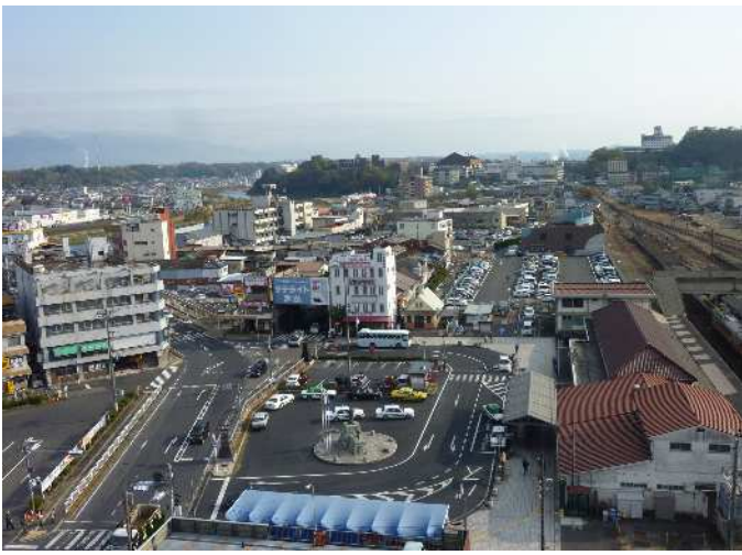
【整備前】 津山駅北口広場 【撮影】平成25年11月