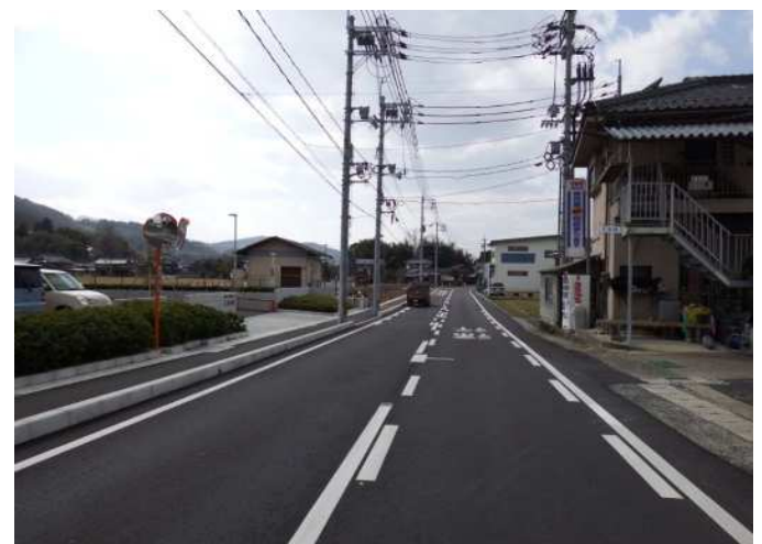
【整備済】 市道G023号線 【撮影】平成27年2月