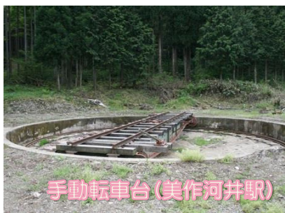
手動転車台 (美作河井駅)