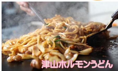
津山ホルモンうどん