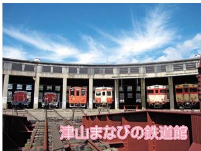
津山まなびの鉄道館