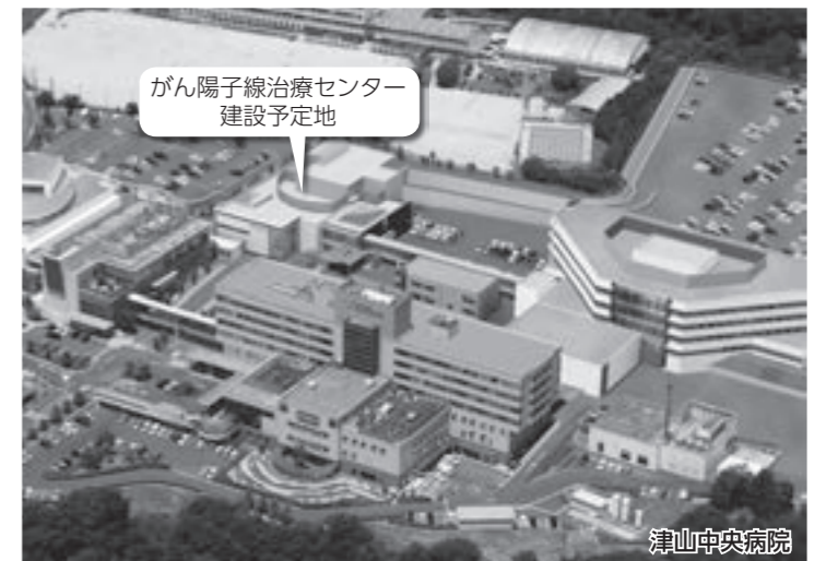
がん陽子線治療センター建設予定地