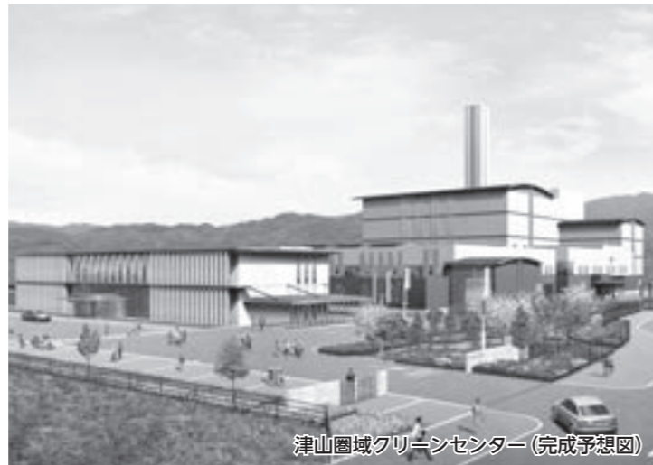
津山圏域クリーンセンター(完成予想図)