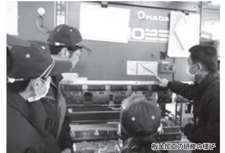
板金加工の研修の様子