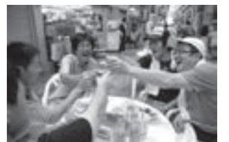
全日本地ビールフェスタ in 津山の様子

にぎわい商人隊は、津山市中心市街地の商店街の代表が集まってできた団体で、まちなかに以前の賑わいを取り戻そうと活動しています。