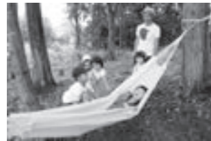
高倉ふれあいの森・プレーパークの様子