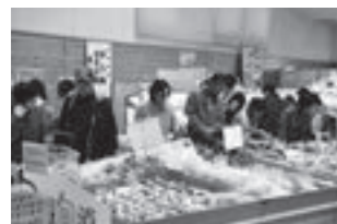
農産物直売施設「活菜館」の様子

道の駅「久米の里」には、出荷する喜びや生きがいを感じている生産者と、新鮮な農作物を安心して低価格で購入したい消費者とをつなぐ、大切な役目があります。