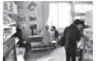
カフェスペースの様子