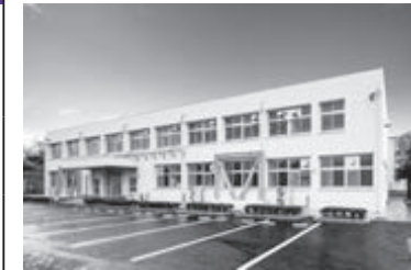
向陽小学校耐震化事業