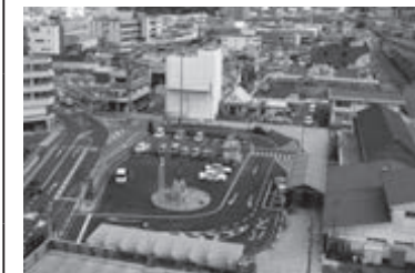
津山駅北口広場整備事業