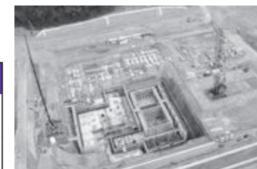
新クリーンセンター建設事業