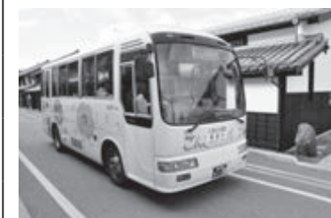
東循環ごんごバス