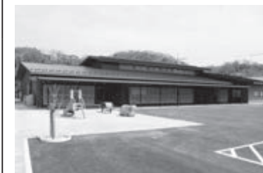
津山東公民館整備事業