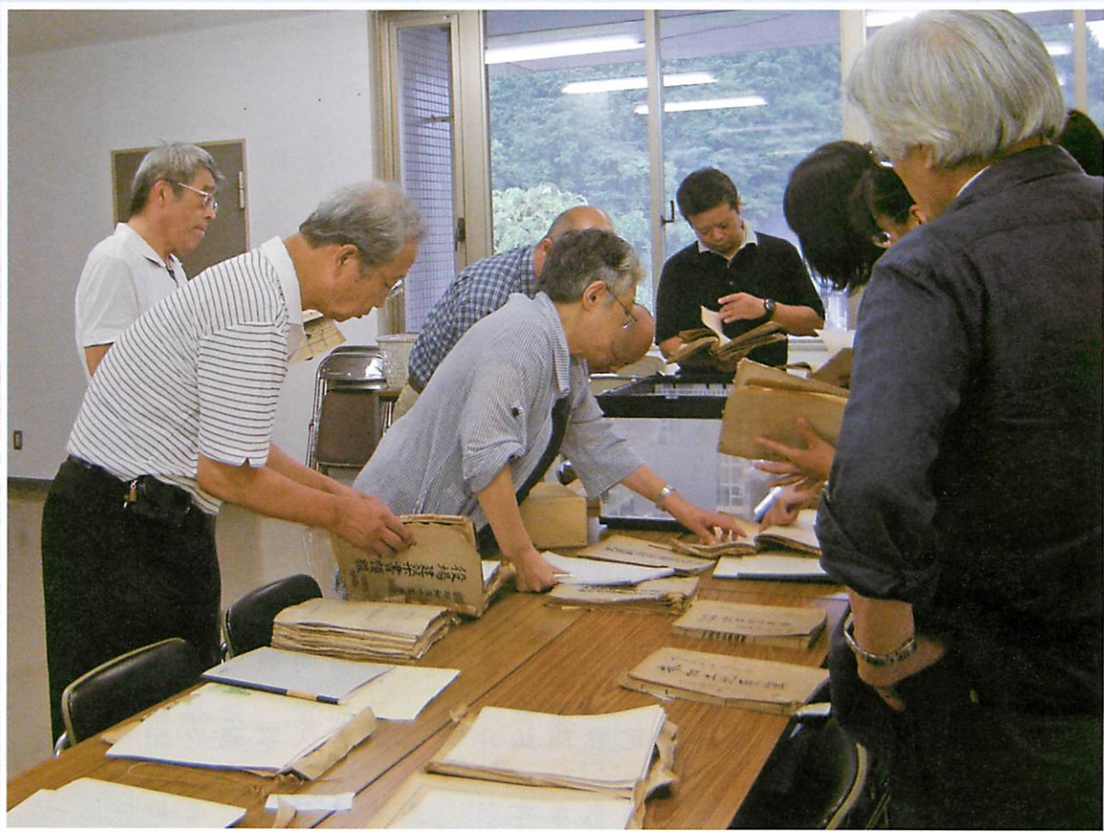
8月22日 近現代部会 支所保管文書調査の様子