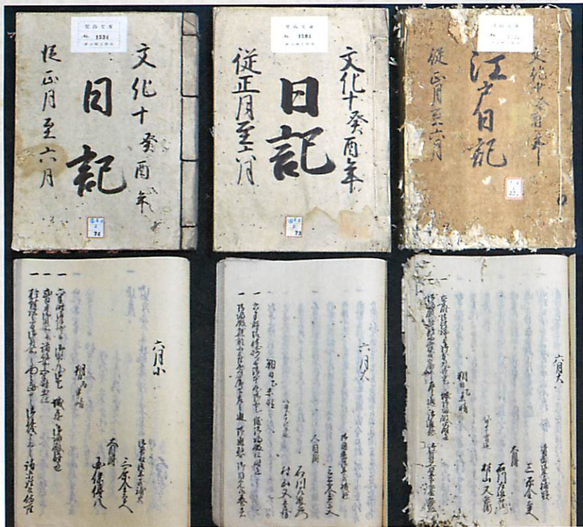
3冊現存する文化10年正月～6月の江戸日記

を作っては送り合っていました。そして、ある時点で6か月ごとに綴じ合わされ、1年が正月〜6月と7月〜12月の2冊に分けて保存されました。これらの日記を所蔵する津山郷