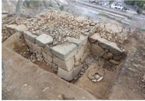
写真7 瓦櫓櫓台と背面石垣4部分（南西から）