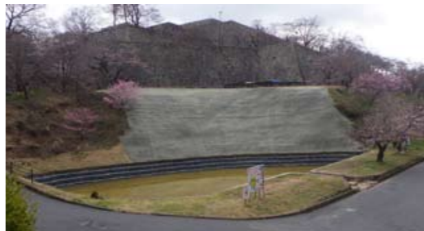
写真10 災害復旧工事完了後（北西から）

※緑化のため植生シートを敷設しています。ふとんカゴは今後水位が元に戻ると隠れます