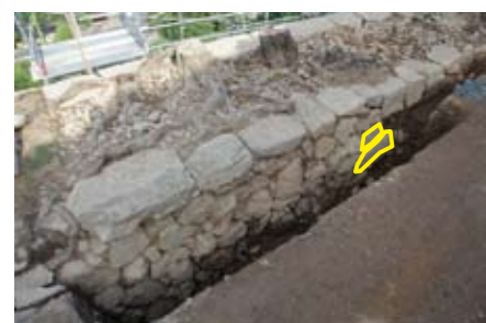
写真2 背面石列 (北西から)

背面石垣3の南には、瓦櫓の櫓台石垣があり、櫓台石垣を挟んで南側で位置を東にずらして背面石垣と同様の石垣がみられます(背面石垣4)。櫓台石垣の幅は東西3.3