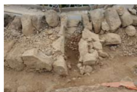
写真4 暗渠排水 (蓋を外した状態)