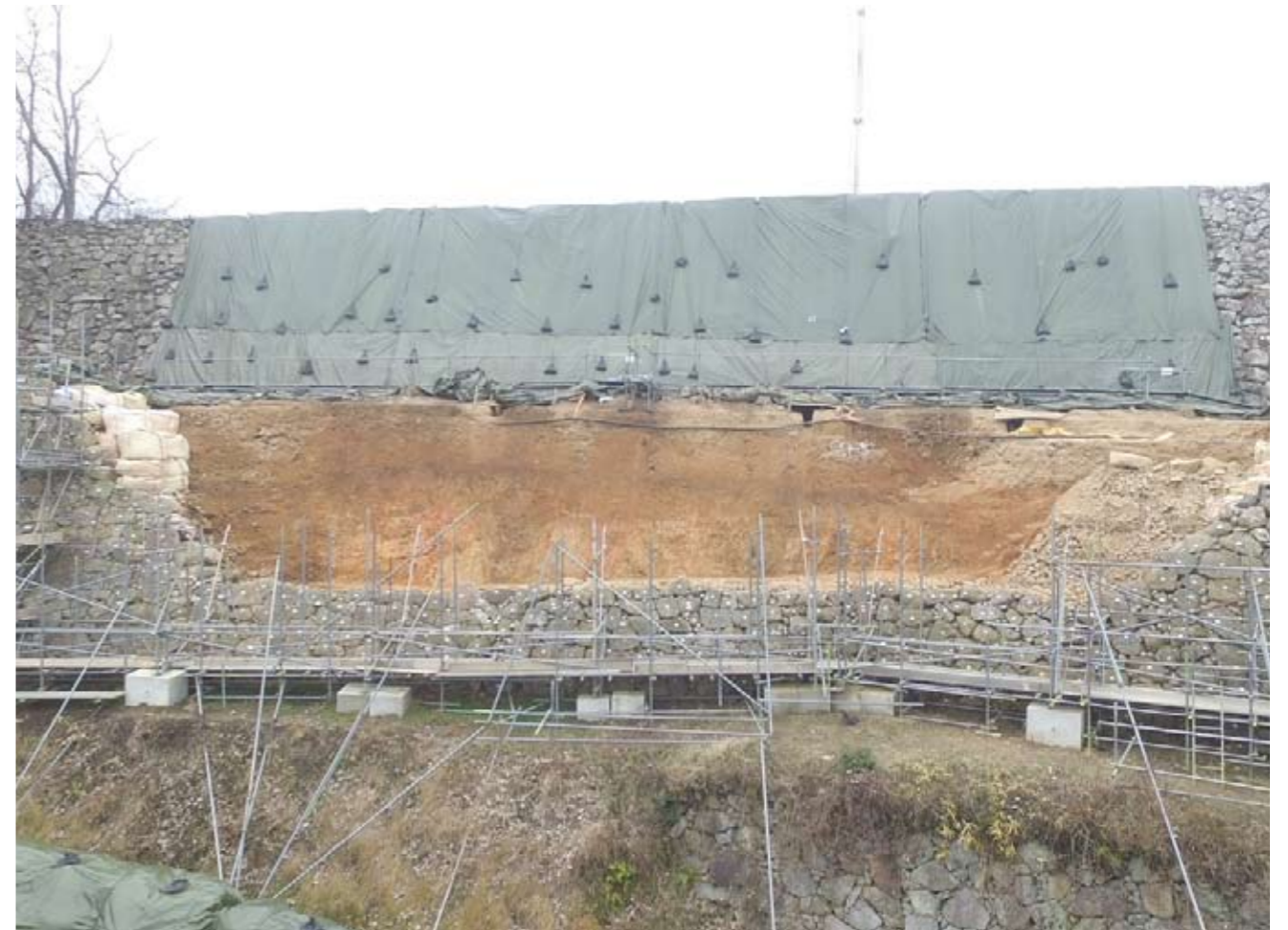
写真1 二の丸東側石垣（東からドローンで撮影）