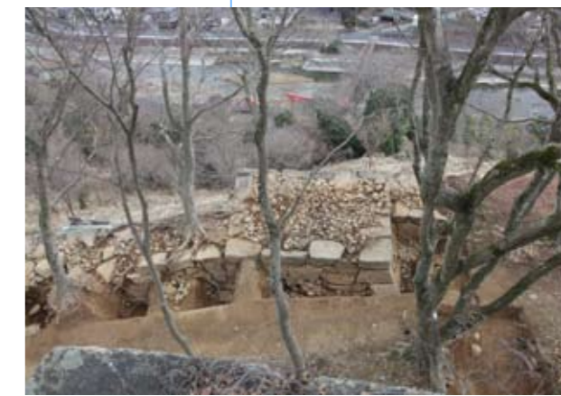
写真6 背面石垣3・4、櫓台石垣 (写真中央が瓦櫓の櫓台、西から)