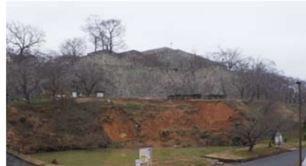
写真9 厩堀法面崩落状況（平成31年1月撮影）（北西から）