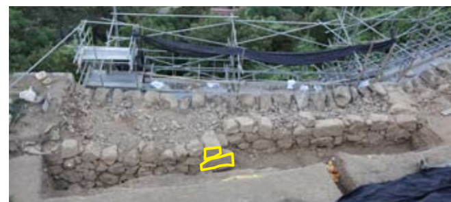
写真3 背面石垣1 (西から)