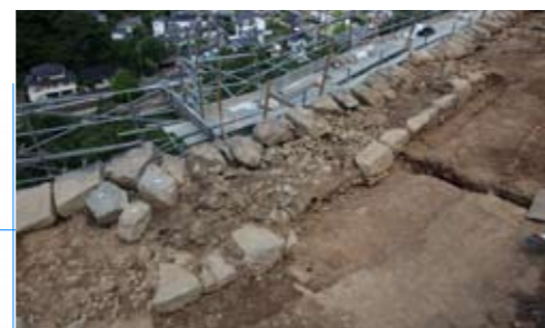
写真5 背面石垣2 (北西から)