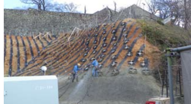
写真8 連続繊維補強土工（令和2年12月撮影）（西から）