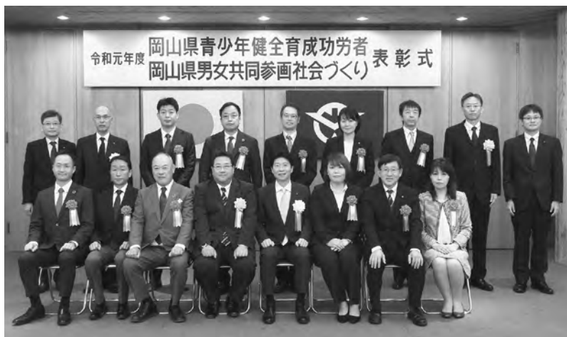
令和元年11月20日に岡山県庁で表彰式が行われました