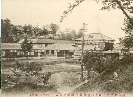
(昭和十四年) 岡山県立津山高等女学校校舎