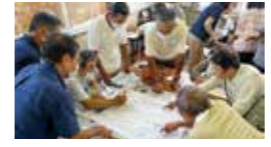
図上防災訓練(DIG)の様子

会場 公民館や集会場など 対象 自主防災組織や町内会、福祉施設、老人会などの任意団体が行う防災研修、学校などで行う防災教室 内容 風水害や地震に関する講話や、避難所運営ゲーム