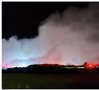
火災発生中の事業所(院庄)

答 二種免許取得支援や効果的な支援を行い、AIデマンド交通の実証実験を進め、既存の事業者の参画を含めた持続可能な地域交通の維持・確保を目指したい。