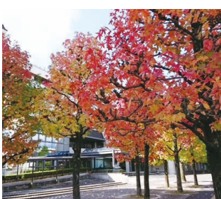
紅葉が美しい「アメリカフウ」