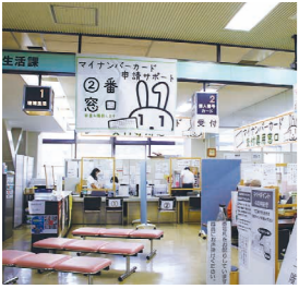
様々なメリットがあるマイナンバーカード

答 3学期から戸島学校食育センターエリアの小中学校でPET樹脂茶碗を導入する。健康に影響はない。