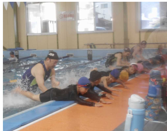
JSS津山スイミングスクール