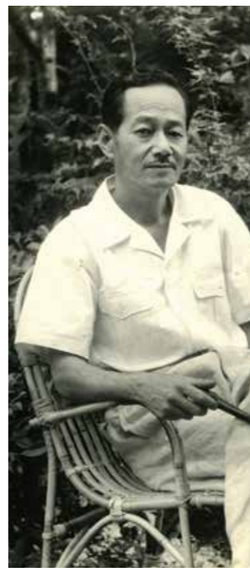
図西東三鬼賞委員会事務局 (文化課内) ☎32-2121