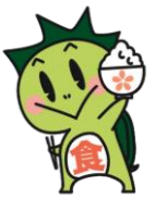
津山市食育推進キャラクター「しよくたん」

●今年度より月に一回『津山・岡山食べようday』を行います。津山産や岡山県産の食材をたくさん食べましょう。献立表でも紹介します！