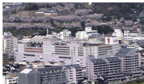
どうなる?今後のアルネ津山

【答】街づくり会社と都市整備公社が共同で実施、運営は都市整備公社が中心を行う方向で検討しているが、共同で実施する事業であること前提にしている。