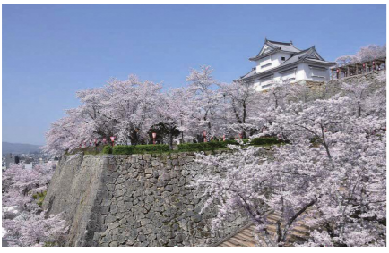
さくらまつりがもたらした経済効果は?

【問】観光DMOの視点で春のイベントからの経済効果は。さくらまつり、第5回牛うまつり、選手権、TsuYamaスィーツフェスティバル津山城などのイベントによる一人当たりの観光消費額は。【答】津山DMOの調べでは、今年、春の動態調査の観光消費額は、速報値として、6,440円。春の動態調査だけをみれば、令和元年