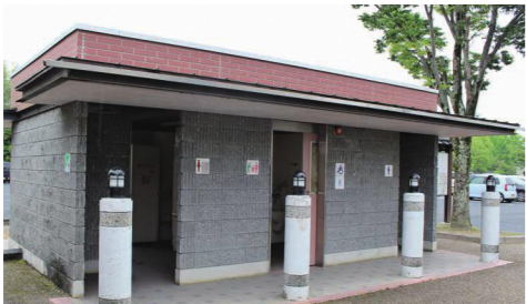
トイレ美化の取組は?

【答】トイレの美化については、利用者への啓発、清掃頻度の見直し、管理体制の構築など様々な視点から対応する。◆【補正予算の公園施設機能向上安全安心事業の内容は。】災害対応の機能を強化するなど、公園の機能を向上させるため、衆楽園南側のプール跡地と沼第4公園のトイレ2か所を、洋式化や多目的トイレの整備を行う。