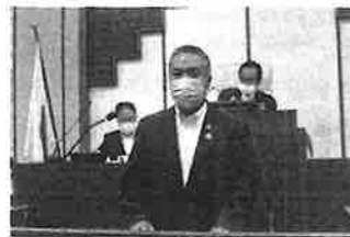
副議長就任あいさつ