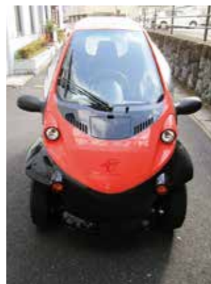
超小型電気自動車