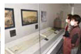
洋学資料館企画展