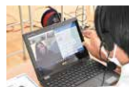
タブレット端末活用