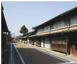
城東地区に道の駅ができる?

へと周遊を促進し、地方創生と観光振興の加速につなげたい。また防災機能も併せて整備することで広域的な防災機能強化も図られると期待する。現在、城東地区の国道53号沿線で早期に事業化できるよう、道路管理者の岡山国道事務所と協議中。具体的な内容を報告できるまでもうしばらくお待ちいただきたい。