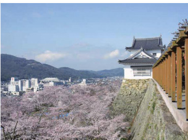
本当に必要な道路整備を

男性が多いと感じるが、女性委員の比率を上げるための取組は。 答 女性の選出を進めるようお願いしており、引き続き登用が図られるよう取り組んでいく。 一部事務組合 問 市から議員報酬をもらっている中、一部事務組合からも議員報酬をもらっているのは二重支給となり、おかしいのでは。 答 一部事務組合は、特別地方公共団体であり、二重支給には当たらない。