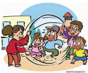
ONE W BUNNETTO

答 令和2年度の通告件数は251件。継続的に支援や見守りが必要な児童は令和4年2月末時点で448人。転居があった場合、関係機関と情報共有し取り急ぎ電話で、改めて文書で支援等の継続を依頼する。