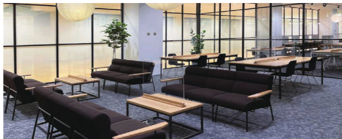
サテライトオフィス「COTOYADO」オープン

施設内は、最新の通信設備と顔認証での入退出管理をはじめとする高度なセキュリティを備えている。コワーキングスペースは、一般の方は、1時間330円、学生は1時間220円で、午前10時から午後7時まで。サテライト라운ジ部分は、午前9時から午後10時30分まで。