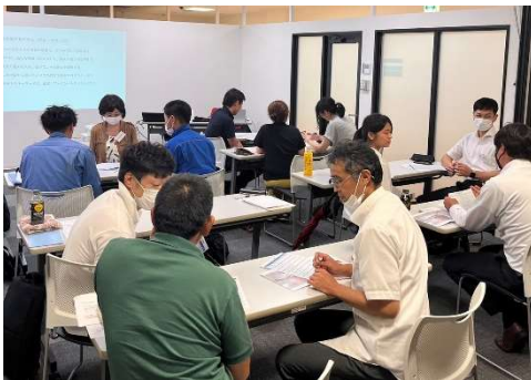
アルネ・津山4階会場での受講風景