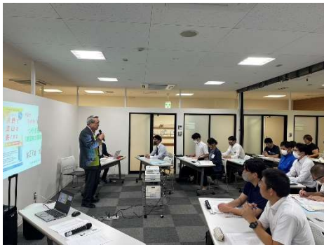
則次塾長によるご挨拶（第1回）

今年もつやま産業塾「経営力開発講座」が受講生20名を迎え、開講しました。今年度は、塾生同士のつながりを意識したプログラムを実践し、最終の成果発表会を2023.12.15に行いました。