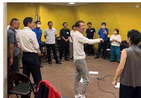
グローブスポーツドームでの受講風景