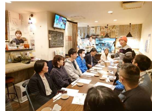
過去の卒塾生徒の交流会風景