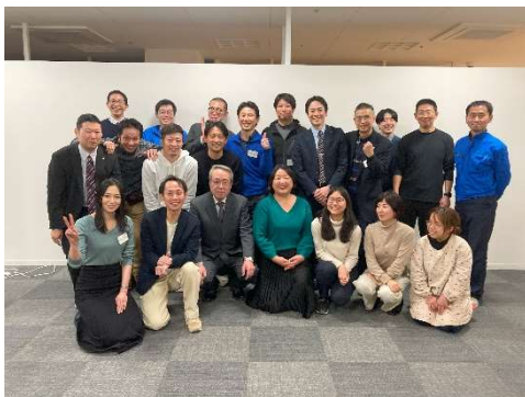
第8回成果発表後の集合写真