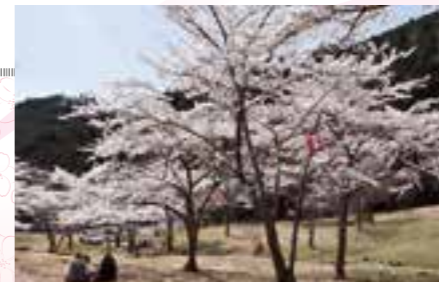
圖 勝北支所地域振興課 ☎32-7024