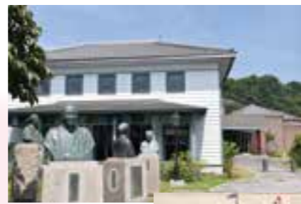
圖 津山洋学資料館 ☎23-3324