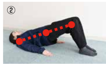
② 背中・腰・ひざが一直線になるようにお尻を「1・2・3・4」でゆっくり上げる