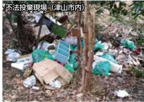
不法投棄現場(津山市内)

※市では、関係機関と連携し、捨てた人への改善指導、防止対策(看板や監視カメラの貸し出し)などを行っています