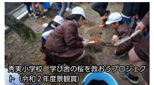
秀実小学校 学び舎の桜を救おうプロジェクト(令和2年度景観賞)