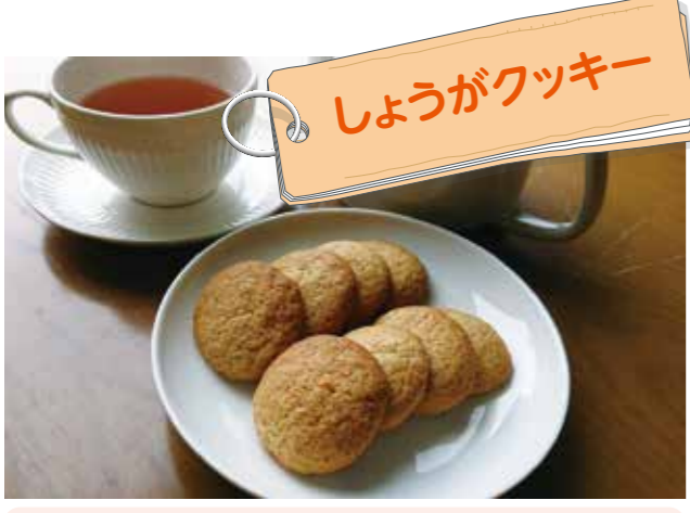
しょうがクッキー

【材料(16枚分)】 ホットケーキミックス…75g、A(ショウガ(すりおろし)…10g、サラダ油…大さじ1、ハチミツ…大さじ1、牛乳…大さじ1)