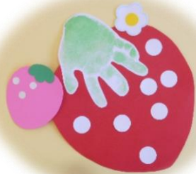
手形アートいちご