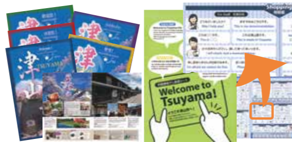
5言語対応パンフレットと指差し会話シート

つやま声ナビは、音声と文字で案内するので便利です。インターネットが使えない場所では、冊子が使いやすいです。