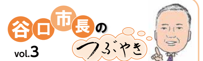
谷口市長のつづき vol.3