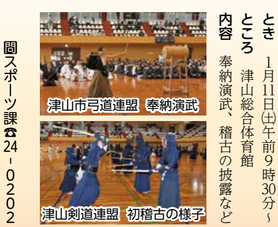
津山市弓道連盟 奉納演武 津山剣道連盟 初稽古の様子