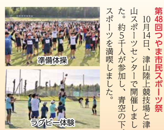
準備体操 ラグビー体験

第48回つやま市民スポーツ祭 10月14日、津山陸上競技場と津山スポーツセンターで開催しました。約5千人が参加し、青空の下、スポーツを満喫しました。