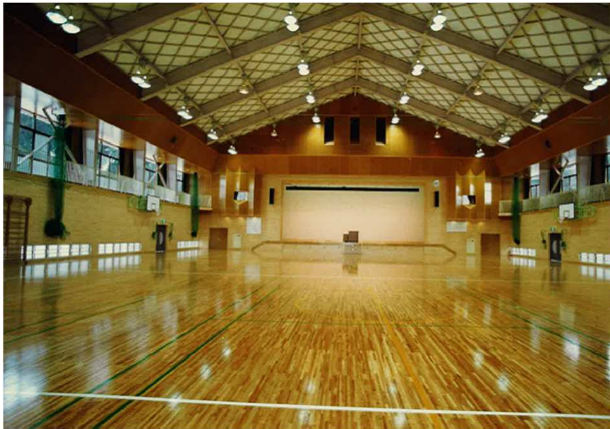
内観 アリーナ バスケットボールコート2面分程の広さがあります