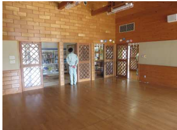
内観 遊戯室 天井が高く開放感があります。