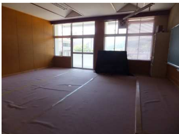
内観 現在使用されていない2階部分です