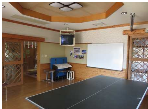
内観 集会室 屋外に直接通じています。