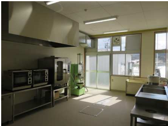
内観 平成28年に改修を行ったため、設備は新しいものが多いです