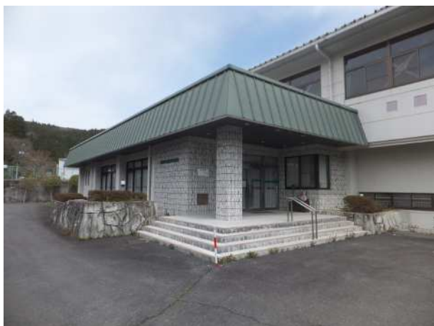
外観 阿波出張所の北側に位置するスポーツ施設です