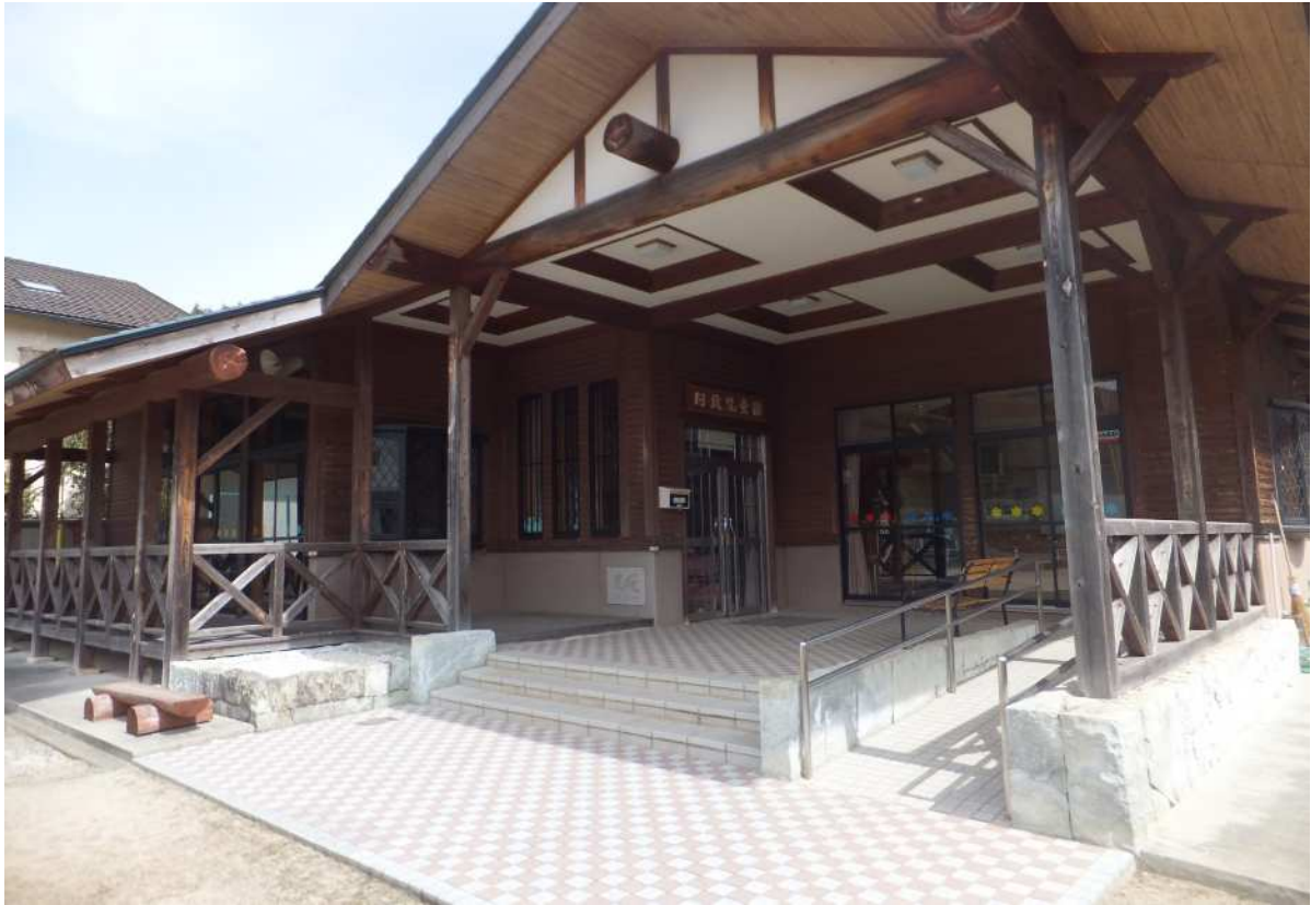
外観 木を基調としており建物全体のデザイン性が高いです。