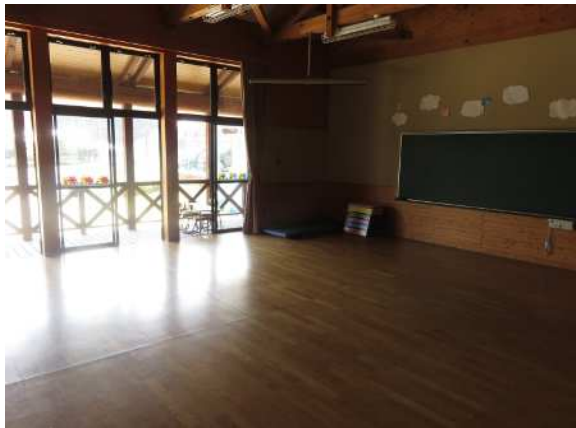
内観 遊戯室 ウッドデッキを介して屋外と繋がっています。