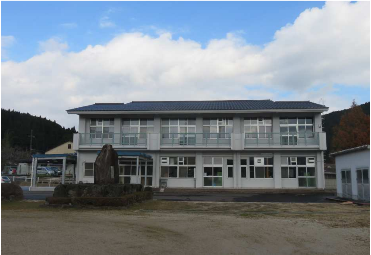
外観 阿波小学校の特別教棟を改修して現在の施設となりました