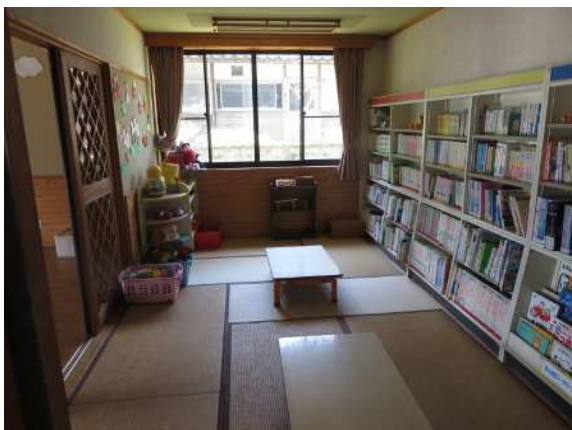
内観 図書室 遊戯室に直接通じています。