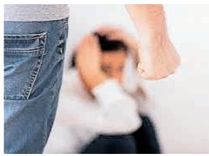
DV 被害に対する支援は急務

答 教育委員会事務局の認識が不十分だった。保護者向けの文書を配付し、適切に対応する。