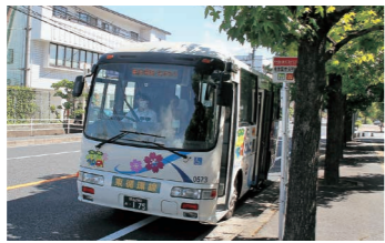
さらなる利用者増をめざす

ごんごバス 問 津山圏域定住自立圏事業で実験中のごんごバス西循環線の鏡野町までの延伸について、利用客の推移と今後の方針は。 答 平成30年11月から令和元年7月までの利用者数は、9,177人で、実証実験前の前年同時期に比べ、2,091人増、5%増となっている。実証実験後の方針としては、当初の目標である8%の利用者増を大幅に上回る結果となったことを踏まえ、地域公共交通