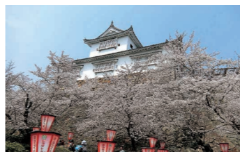
故郷の象徴のさらなる活用を

観光 問 観光立市宣言までした本市の玄関口である津山駅西側のトイレにトイレットペーパーを設置していない状態でおもてなし、などと掲げるのは恥ずかしくないか。 答 機会を捉え、JRの考えを伺いつつ、利便性・機能性向上のため取り組んでいく。