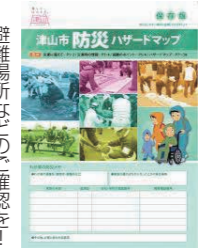
避難場所などの確認を！

防災対策 問 昨年作成した全戸配布した防災ハザードマップの市民評価はどうか。更新時期と周知方法は。 答 前年平成25年に配布した防災ハザードマップに比べ、市内全地域を1冊にまとめたことで、わかりやすくなったとの意見がある一方で、地図の縮尺が小さく見づらいとの指摘も一部である。現在、県が市内の土砂災害特別警戒区域の指定を進めており、調査が終了した地域には、説