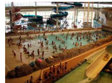
【小牧市温水プール】