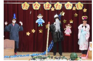
職員による七夕の劇

自分たちで栽培・収穫した夏野菜を使って素敵な体験ができた年長組！《健康な心と体》《自然との関わり》《豊かな感性と表現》