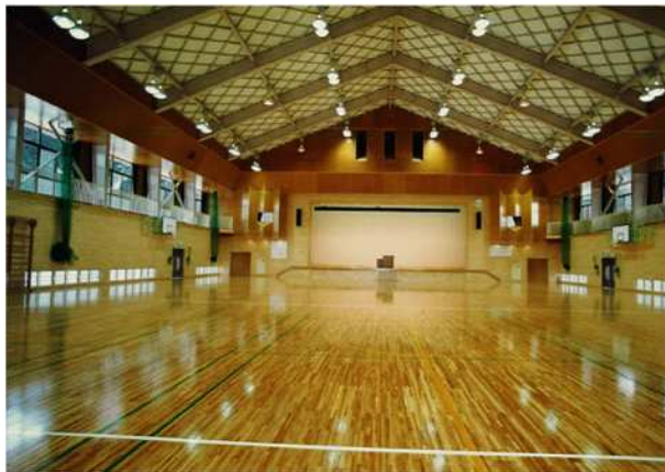
内観 アリーナ バスケットボールコート2面分程の広さがあります