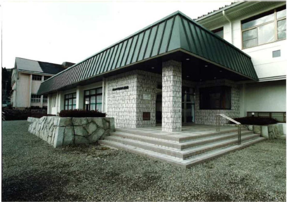
外観 阿波出張所の北側に位置するスポーツ施設です