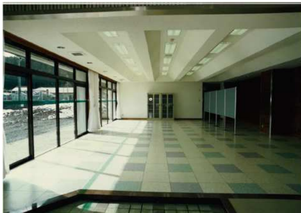
内観 ミーティングルーム 広さは約100㎡でアリーナ南側に位置しています