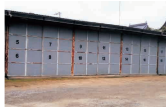
だんじり保管庫の行方は？

【その他の質問項目】 津山城郭と重要伝統的建造物群保存地区の現状と今後の展開とまちの駅について