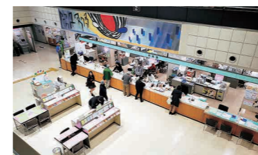
ていねいで親切な対応が求められる窓口職場

【答】 津山市が昭和43年に八子保管庫を設置し、現在に至っており、10台のだんじりが保管してある。保管庫設置から50年経過し、保管庫の役割を果たしているとは思えない。今後の行方は、