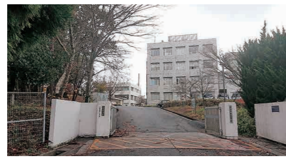
産業支援センターの要：津山工業高等専門学校

【答】 津山市が昭和43年に八子保管庫を設置し、現在に至っており、10台のだんじりが保管してある。保管庫設置から50年経過し、保管庫の役割を果たしているとは思えない。今後の行方は、