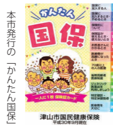
本市発行の「かんだん国保」

【答】 津山市が昭和43年に八子保管庫を設置し、現在に至っており、10台のだんじりが保管してある。保管庫設置から50年経過し、保管庫の役割を果たしているとは思えない。今後の行方は、