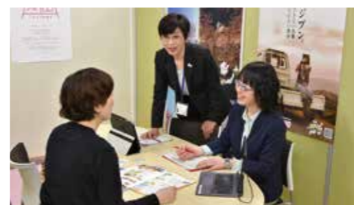
▲津山ぐらし移住サポートセンターでは気軽にご相談いただけます

平成30年4月、津山圏域雇用労働センター内に「津山ぐらし移住サポートセンター」を開設しました。津山市への移住を検討している人に対して、生活環境や住宅、仕事のことなど、I・J・Uコンシェルジュ（2人）がきめ細やかに対応し、円滑な移住・定住を支援しています。皆さんの知り合いに、津山市への移住を検討している人がいたら、ぜひ、津山ぐらし移住サポートセンターを紹介してください。