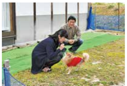
▲自宅の庭に、夢だったドッグランを作ることができました

津山は鳥取県などの山陰地方や大阪などの関西地方への交通の便が良く、旅行を趣味とするわたしたちにとって、最適の生活環境です。