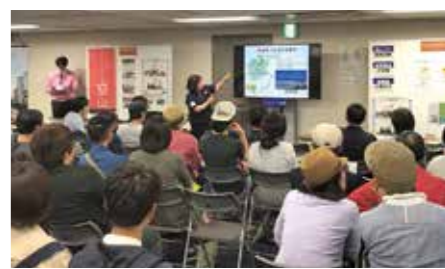
▲東京都や大阪府で開催している津山の移住相談会に多くの人々が来場しています