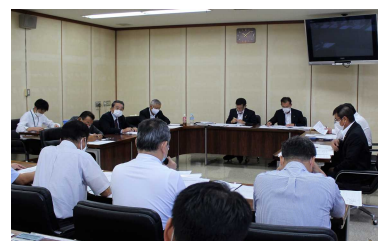
《常任委員会のようす》