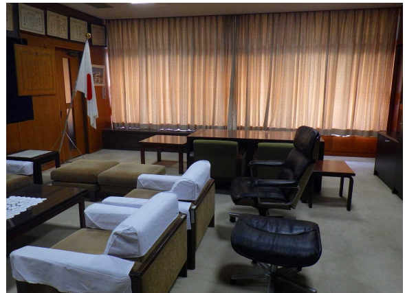
旧村長室 応接家具も備えています。