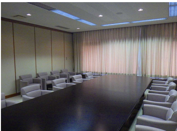
旧会議室 会議机、椅子、間仕切りもあります。