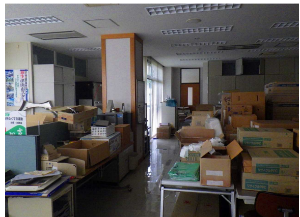
2階執務室 遊休化し、倉庫として使われています。