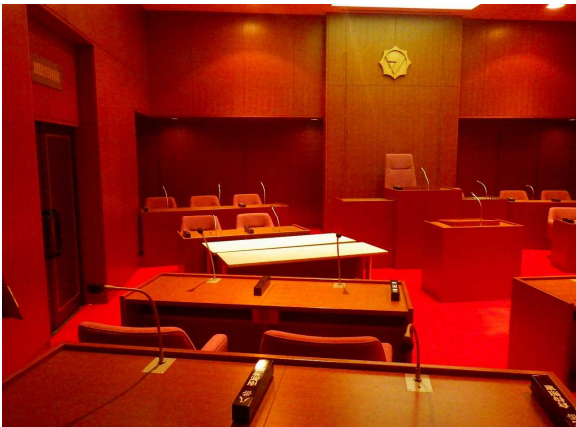
旧議場 放送設備もあります。