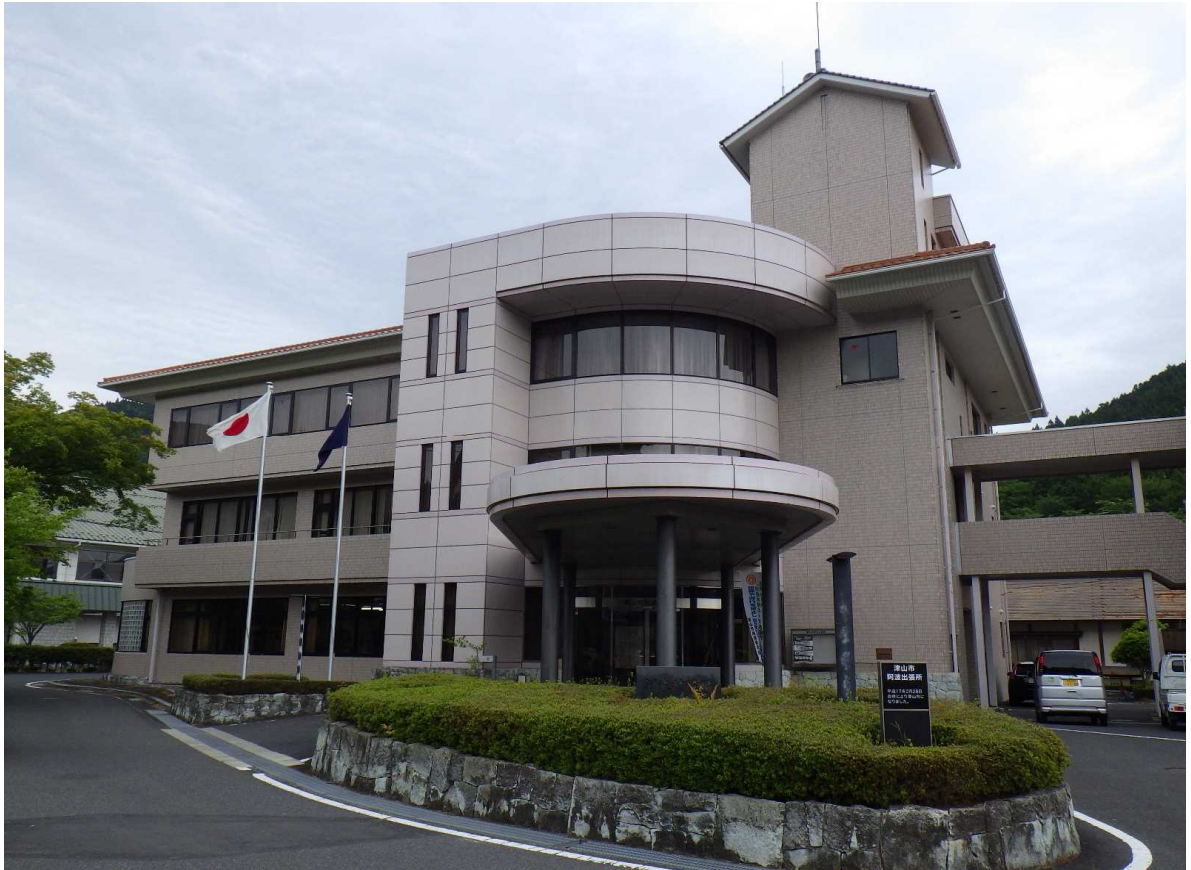
外観 西側からの外観。地上3階建て、タイル外壁、屋根は陸屋根+瓦屋根。