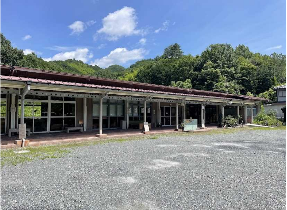
外観 横に長い施設で、南側に園庭が開けています。山あいの静かな場所に立地。