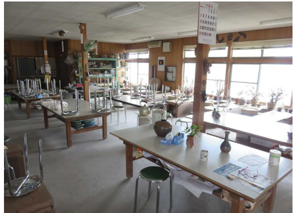
作業棟内部 陶芸作業用のテーブルが並んでいます。