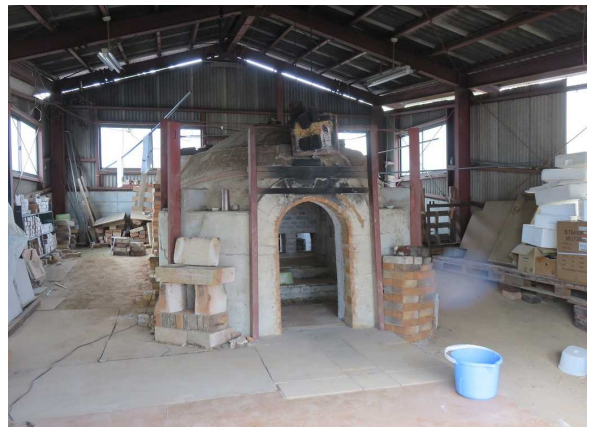
登り窯内部 本格的な登り窯が整備されています。