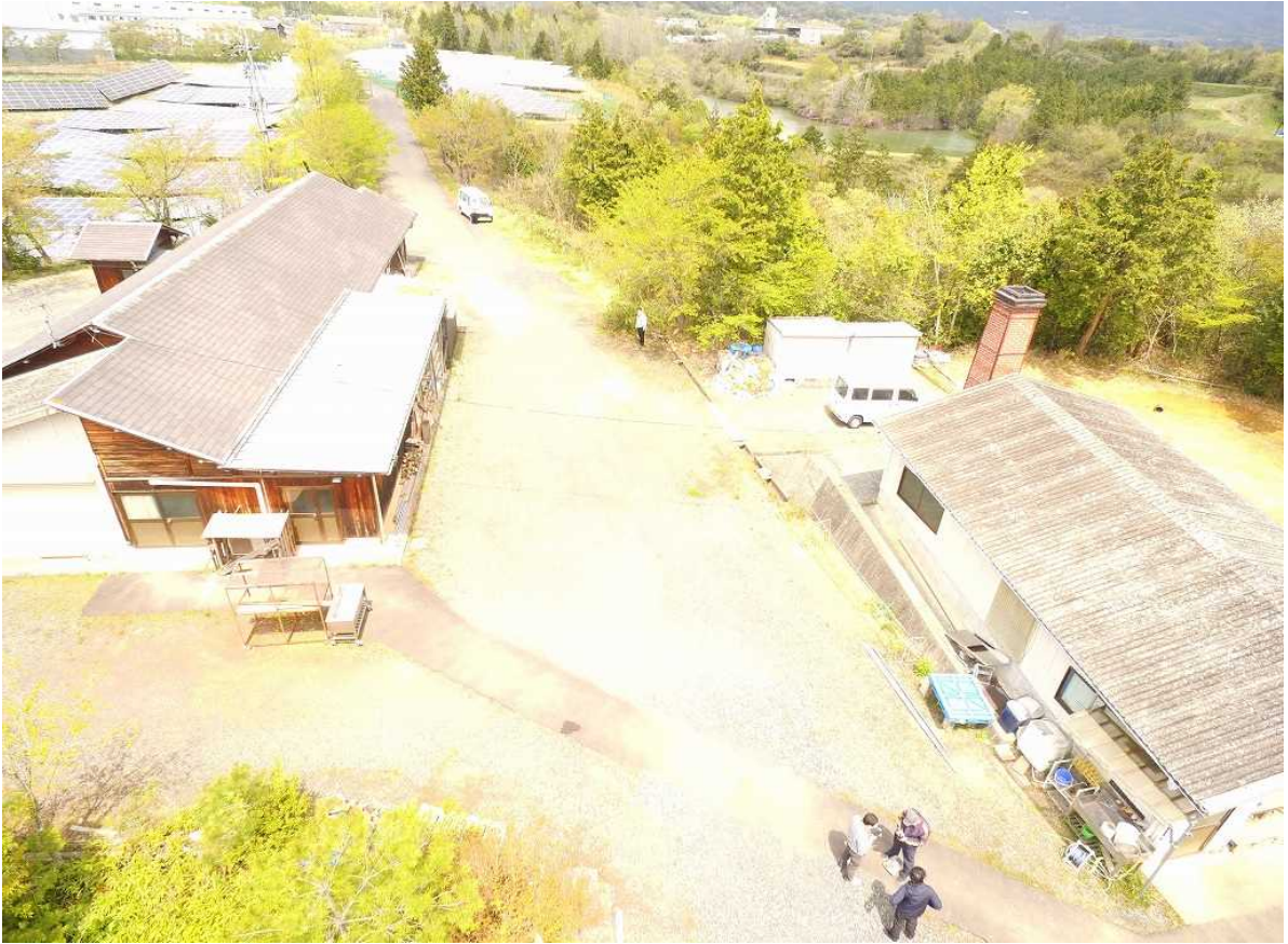
上空から 周辺は緑が広がっています。