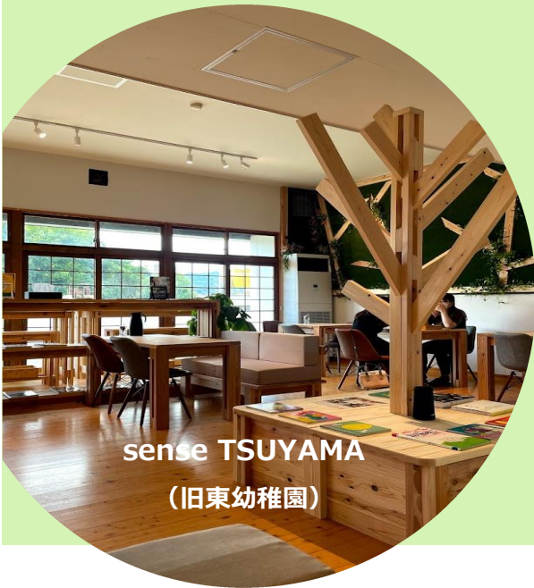
sense TSUYAMA (旧東幼稚園)