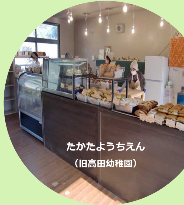
たかたようちえん (旧高田幼稚園)