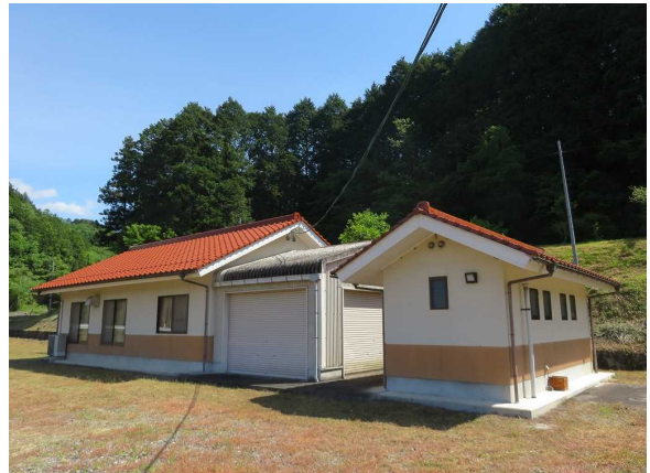
屋外トイレ棟外観