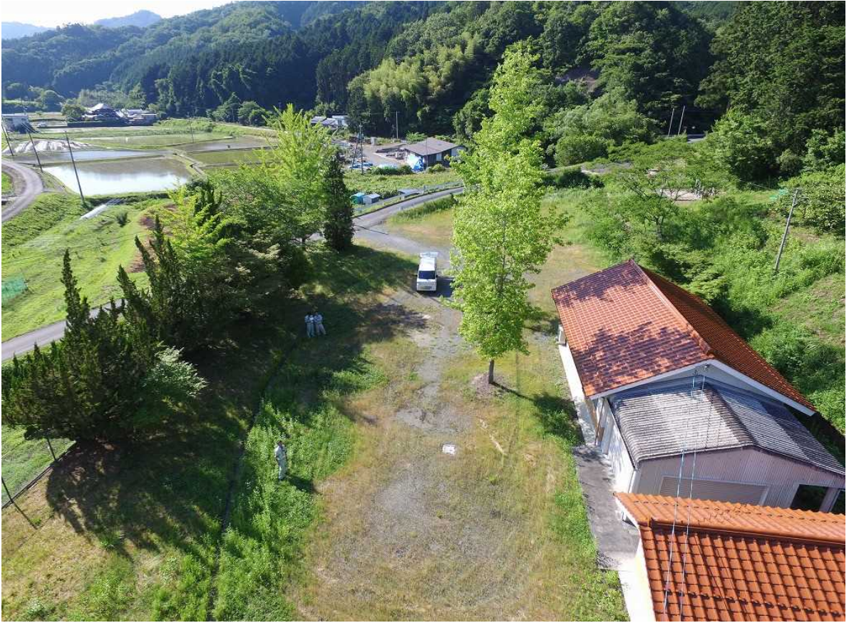
上空から 周辺は田園風景が広がっています。