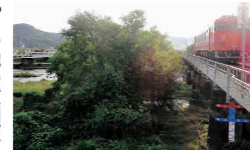
河川樹木の処理が待たれる

問 7月豪雨災害における民有地被害への対応はどうか。 答 私的自治の原則の観点から、行政からの干渉は極力控えるべきものである。復旧費用の助成措置については、行政的支援の許容性や必要性の検証はもとより、様々な災害被害の実態を踏まえ、具体的支援策についての確信や公平性などの観点から検討を行う必要があるため、今後の課題として鋭意研究していきたい。