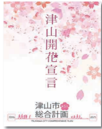
子どもたちが誇りに思えるようなまちづくりを

答 「10年後の津山について」という題名で子ども達が真剣に津山のことを思い書いてくわっている。津山を思い、将来を担ってくれる人材に育ち、誇りと喜びを感じて暮らしていけるようなまちを実現できるような施策を実施していかねばならぬ。