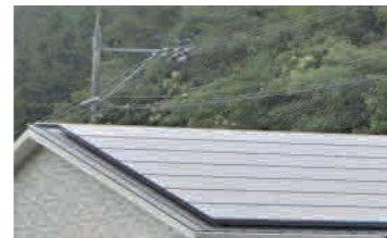
個人住宅の屋根の太陽光発電

問 個人住宅太陽光発電設置について、補助金・撤去が必要との広報、条例等の策定は。 答 補助は平成22年度で788件。計画的な費用の確保の広報、周知に努める。条例について国の動向を見ながら研究してみたい。 問 行政運営サマリーレビューの目的は。 答 事務事業の見直しを行い効率的な行政運営に資することである。