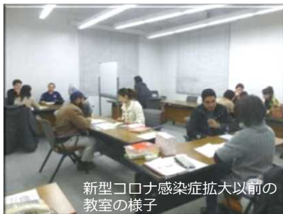
新型コロナウイルス感染症拡大以前の教室の様子

津山にほんごの会は、津山市内や周辺地域で生活している外国人市民の利便性の向上を目指して、市内4ヶ所で日本語教室を運営し、日本語習得のお手伝いをしています。