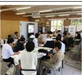
活動報告会兼交流会