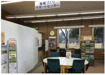
津山市地域づくりサポートセンター

ご来所のみなさんの主な利用目的は、センターに設置されている情報コーナーのご利用や、常駐スタッフとの情報交換です。また、市役所内の各部署とも連携し、人・活動・地域と行政のマッチング役も担っています。