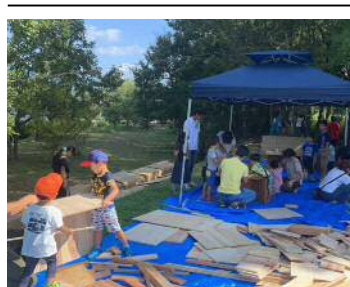
木工あそびもありました