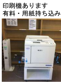
印刷機あります 有料・用紙持ち込み

創刊号から1年。様々なことがありました。いきいき新聞はこれからも毎月発行していきますので、今年もよろしくお願いたします！