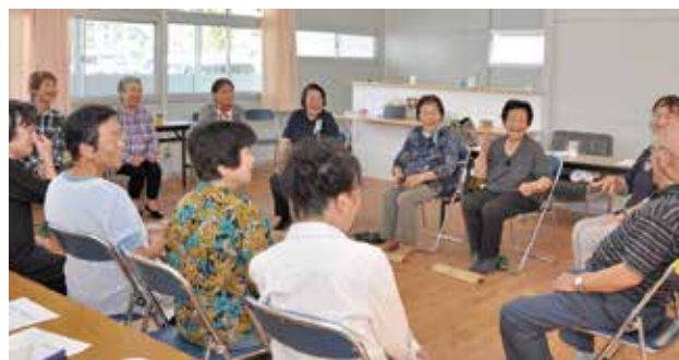
ふらっとカフェ神南備園