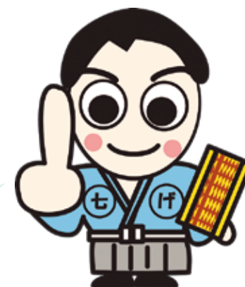
学力向上シンボルキャラクター げんぽくん

また、英語の発音を聴いたり、立体の図形を画面上で回転させたりすることもでき、子どもたちが視覚的に理解しやすくなる仕組みだよ。