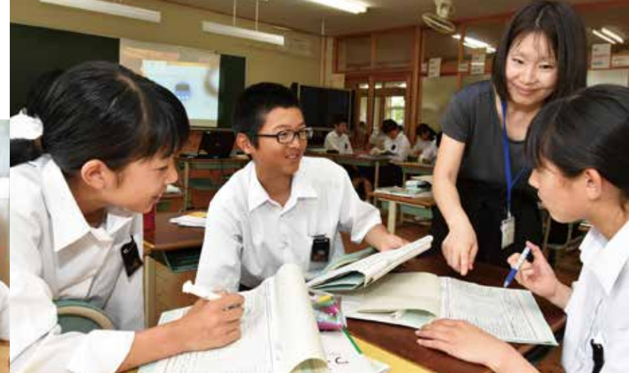
グループで英語を学ぶ久米中学校2年生