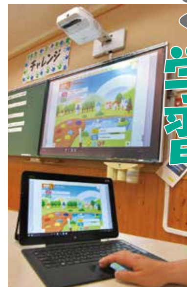
指導用タブレットパソコンを使ってスクリーンに映し出す様子

授業が視覚的に分かりやすくなる「デジタル教科書」や、「プロジェクト」「指導用タブレットパソコン」「無線LAN」などのICT(情報通信技術)機器。市内の学校でも、平成29年度から本格的に導入を開始し、すべての小中学校の授業で活用できるように進めています。