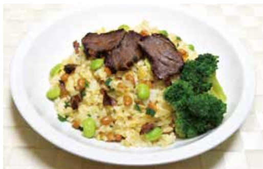
津山産のジャンボピーマンやごんご豆(大豆)などを使った「干し肉の納豆チャーハン」

味噌や麹など日本古来の発酵食品の研究や、地域の食材を使ったレシピの考案などに取り組んでいる。平成29年8月に東京都で開催された「第1回全国高等学校納豆甲子園」に出場。予選を通過した全国6ブロックの代表校の中から3位入賞を果たした。