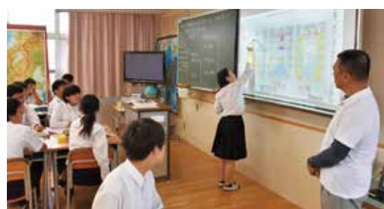
デジタル教科書に書き込む生徒

また、生徒たちの表情で理解の進み具合を感じ取り、前の画面に戻って反復学習をすることもあります。今後、活用方法を工夫して、生徒たちの学力の向上に取り組んでいきます。