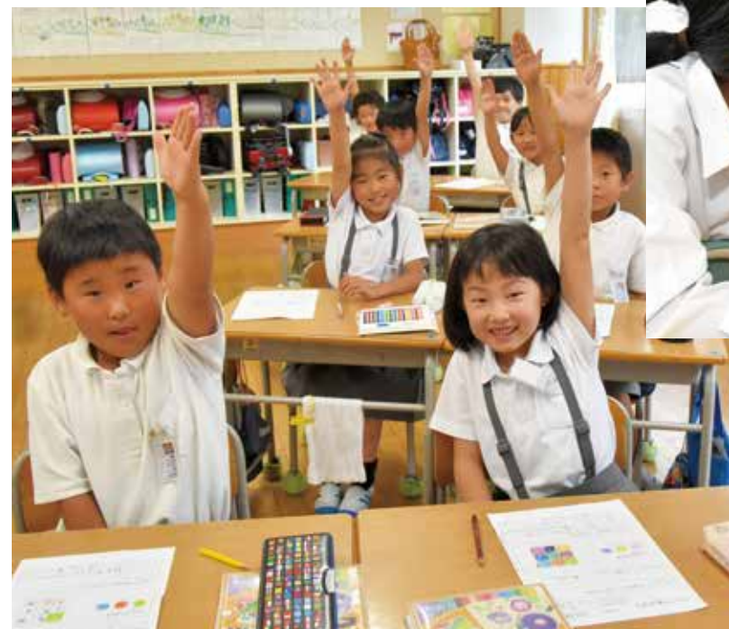
元気良く手を挙げる林田小学校2年生