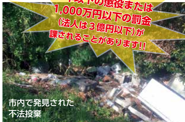
市内で発見された不法投棄

※市では、関係機関と連携し、投棄者の究明、改善指導、防止対策（不法投棄禁止看板や監視カメラの設置）、不法投棄禁止についての啓発などを行っています