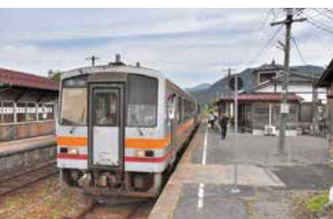
現在のJR美作加茂駅

写真は、昭和40年10月に、国鉄美作加茂駅（現在のJR美作加茂駅）で行われた準急みささ号の歓迎式典の様子を写したものです。みささ号は、姫新線と因美線を経由し、大阪・倉吉間を結ぶ準急（後に急行に昇格）として昭和35年に登場しました。当初、美作加茂駅は停車駅ではありませんでしたが、昭和40年10月のダイヤ改正で、念願の停車が実現しました。 当時の広報紙によると、この停車を祝い、町長をはじめ、たくさんの方々が参列し、加茂中学校生徒の吹奏楽の演奏で列車を迎え入れ、花束を贈呈しました。 しかし、時代が進むにつれ、高速道路の開通などで、自動車やバスを使った移動が便利になり、列車の利用者は減少していききました。そして、平成元年3月のダイヤ改正で、みささ号は廃止となりました。廃止を伝える当時の新聞によると、週末には1日150人程度いた乗降客が、廃止前には、盆と正月の帰省客を除き、ほとんどいない状況になっていたようです。 昭和40年の因美線の賑わいを垣間見ることのできる貴重な一枚です。