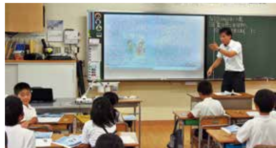
デジタル教科書を使った授業の様子