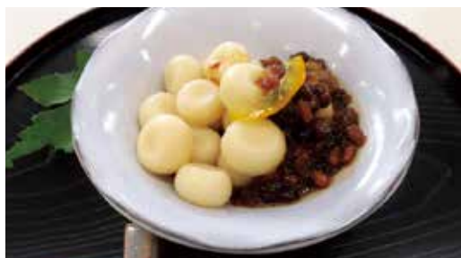
小豆と蜂蜜などを使った「みたらし納豆団子」