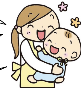
園の看護師さんの声