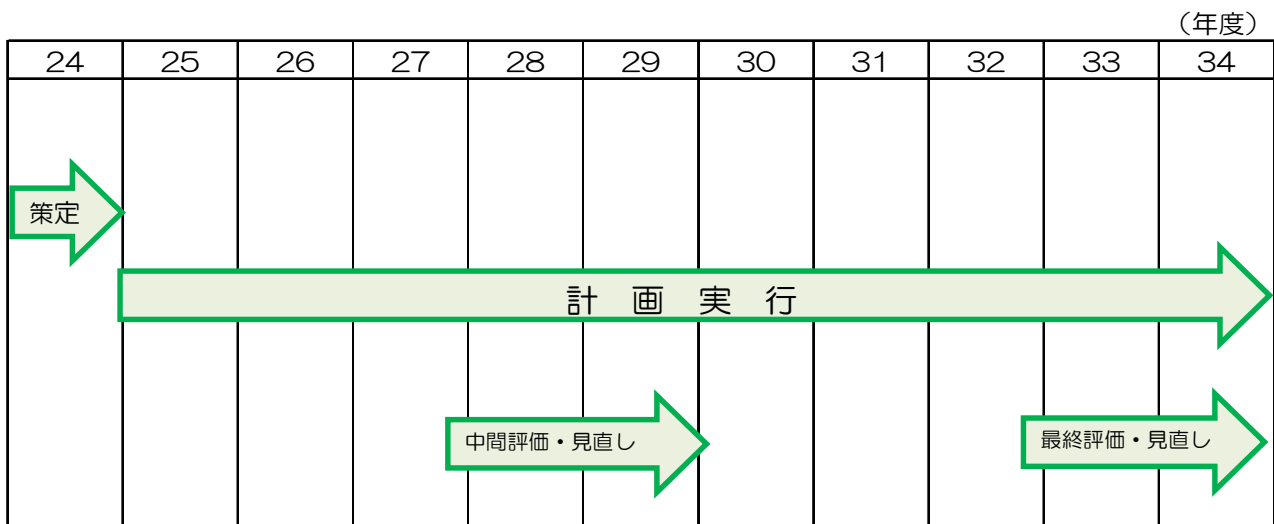
図 3 計画期間

計画期間は、平成 25 年度（2013 年度）から平成 34 年度（2022 年度）までの 10 年間です。平成 29 年度（2017 年度）に計画の中間評価と見直しを行いました。